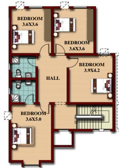
مقترح الإضافة المستقبلية (3)