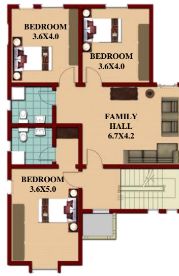
مقترح الإضافة المستقبلية (1)