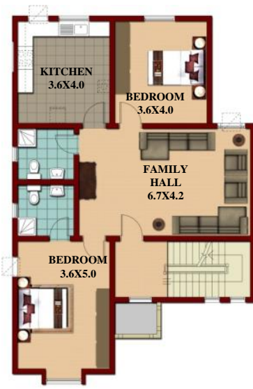
مقترح الإضافة المستقبلية (2)