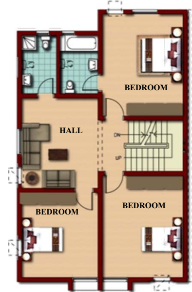
الطابق الثاني (الإضافات المستقبلية)